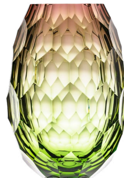
váza / oceanit - růžová 14,5 x 30 cm 3211

Základní vejčitý tvar robustní vázy se díky rafinovanému šestiúhelníkovému broušení tříští do mozaiky mnoha možných pohledů na stejnou realitu. Ostré hrany plástvovitých buněk oddělují jednotlivé střípky, aby se vzápětí mohly spojit do nového příběhu.