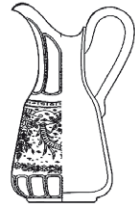
4419 džbán / jug C: 1500 ml / 1.5 qt. H: 30,2 cm / 11.9 inch