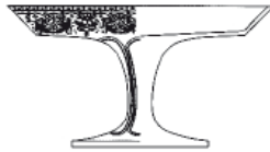
4400/N nástolec / centrepiece H: 18,9 cm / 7.4 inch W: 35 cm / 13.7 inch