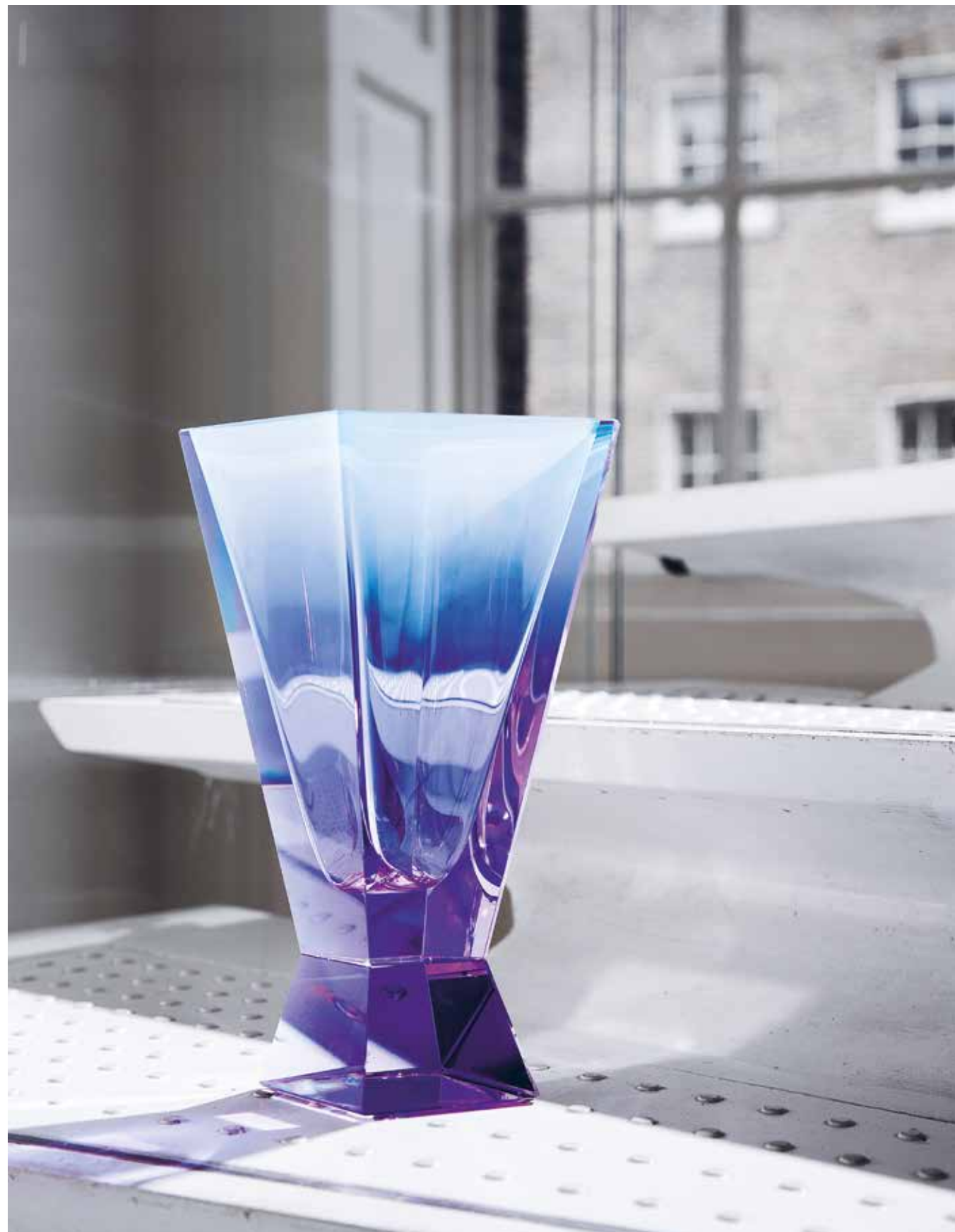
Váza Bariel, design: Jiří Suháček, ručně foukáno z bezolovnatého křišťálu, ručně broušeno a ručně leštěno do vysokého lesku